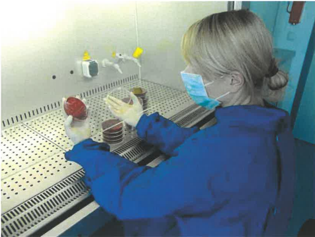
Gezielte Tätigkeit mit biologischen Arbeitsstoffen in der Mikrobiologie

Die erforderlichen Schutzmaßnahmen sind in den Anhängen II bis III der Biostoffverordnung unter der jeweiligen, im 2. Schritt ermittelten Schutzstufe wiedergegeben. Unabhängig davon sind immer die allgemeinen Hygienemaßnahmen der Schutzstufe 1 festzulegen.