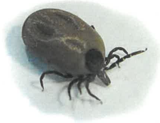
Ixodes ricinus als Vektor für die Übertragung von FSME-Virus und Borrelien