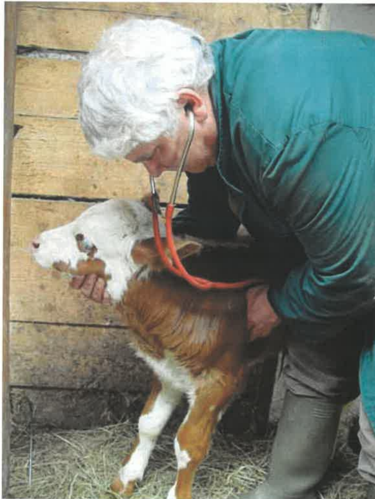
Nicht gezielte Tätigkeit mit biologischen Arbeitsstoffen bei der Untersuchung von Tieren

Bei den arbeitsmedizinischen Vorsorgeuntersuchungen sind zu unterscheiden: