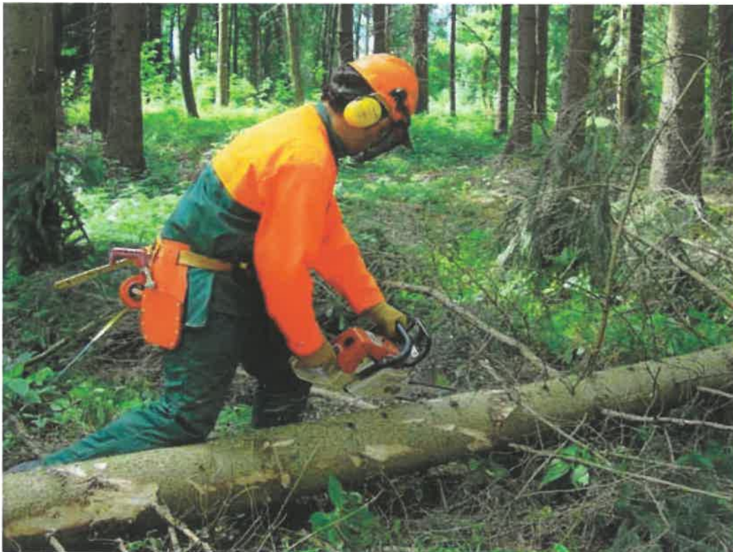
Nicht gezielte Tätigkeit mit biologischen Arbeitsstoffen bei Waldarbeiten: Gefährdung durch von Zecken übertragene Krankheiten, z. B. Borreliose, Frühsommer-Meningoencephalitis (FSME)

Neu hinzugekommen ist in § 15 a eine deutliche Differenzierung der Untersuchungsanlässe für Pflichtuntersuchungen bzw. Angebotsuntersuchungen. Die Durchführung der Pflichtuntersuchung ist Voraussetzung für die Beschäftigung oder Weiterbeschäftigung mit der entsprechenden Tätigkeit. Eine Pflichtuntersuchung ist nicht erforderlich, wenn der Beschäftigte bei impfpräventablen biologischen Arbeitsstoffen über einen ausreichenden Immunschutz verfügt. Ansonsten hat der Arbeitgeber zu veranlassen, dass dem Beschäftigten im Rahmen der Untersuchung die entsprechende Impfung angeboten wird.