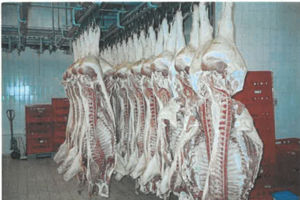
Nicht gezielte Tätigkeit mit biologischen Arbeitsstoffen in der Lebensmittelproduktion