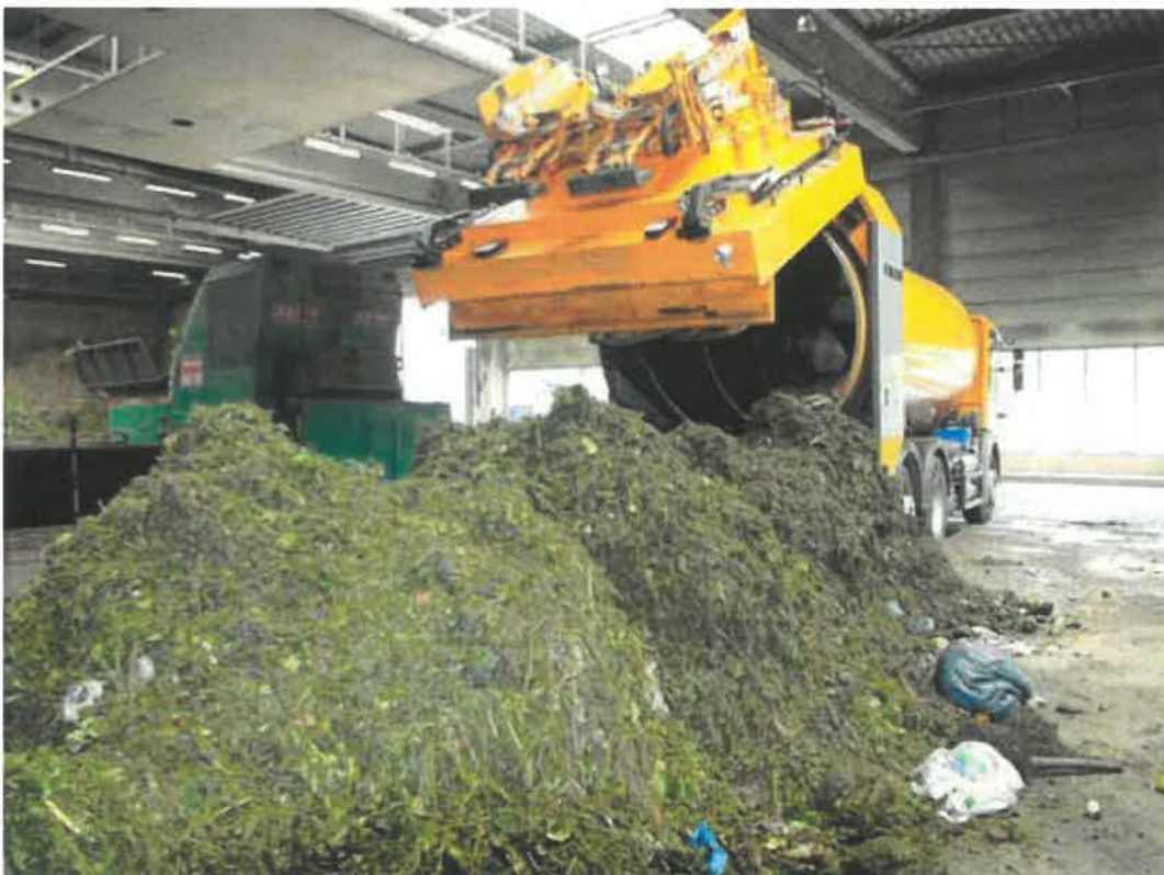
Nicht gezielte Tätigkeit mit biologischen Arbeitsstoffen bei der Anlieferung von Bio-Abfall

Das Ergebnis der Gefährdungsbeurteilung ist in Schriftform festzuhalten und muss der zuständigen Aufsichtsbehörde auf Verlangen vorgezeigt werden. Unter bestimmten Voraussetzungen kann auf eine schriftliche Dokumentation verzichtet werden (siehe S. 4 f).